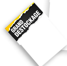
MINI ETIQUETTE en 14,7x21 cm