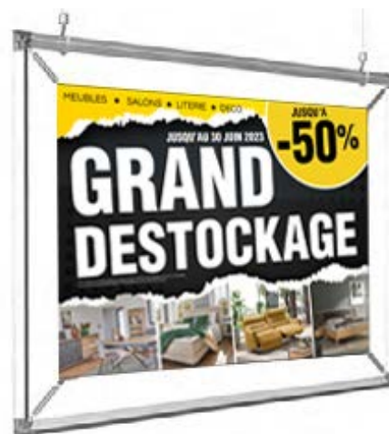
AFCA en 80x60 cm