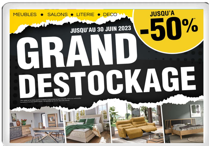
AFFICHES Toutes dimension sur devis