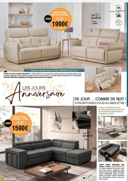
- page 6/7 -