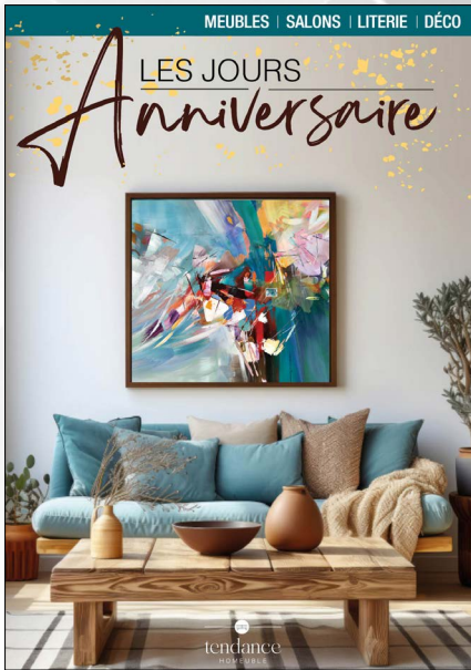
- Couv -

Impression quadri sur 90 grs - poids environ 23 grs.