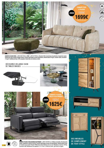
- page 4/5 -