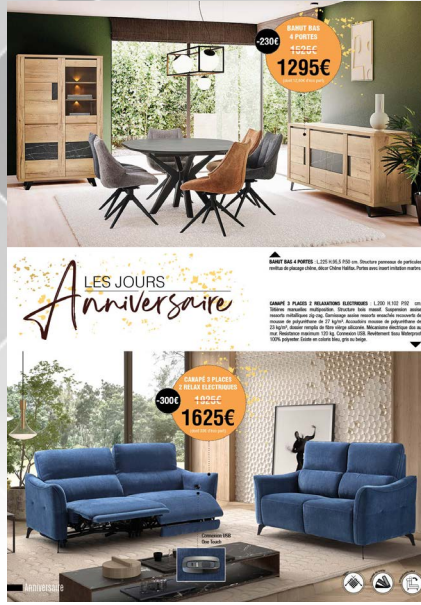
- page 2/3 -